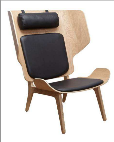
Belles matières. Norr11