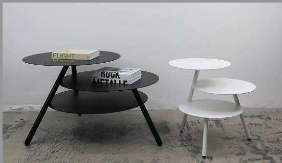
Simplement efficace. Pulpo