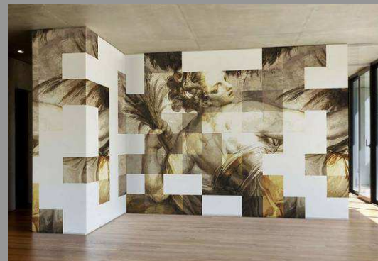
Papier peint modernisé. Yn 2