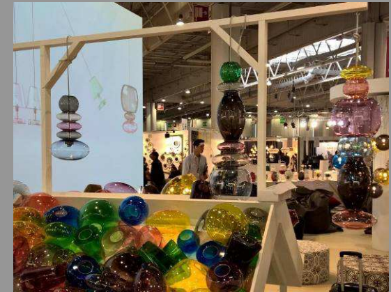
Composez votre suspension ! Fatboy