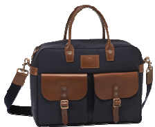
Safari sur Seine. Longchamp

Vous avez toujours quelque chose à emporter : portefeuille, parapluie, documents de travail, ordinateur, bouquin... et je ne rentre pas dans l'exploration d'un sac féminin. Visez donc une taille suffisante, une belle matière et une couleur que vous pourrez marier facilement. Quant au style, pensez que vous pouvez l'embarquer aussi bien pour vous rendre au bureau que pour vous accompagner en week-end.