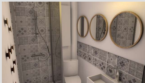
Démarrage des travaux