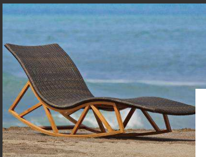
Relax Une berceuse pour une sieste parfaite