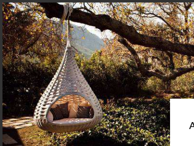
Cocon A suspendre ou à poser pour un moment privilégié