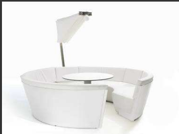
Versatile Parasol... ou pas Table...ou pas L'ensemble s'adapte à vos envies

C'est le printemps ! L'envie est grande de profiter à nouveau des extérieurs, de redécouvrir le plaisir de bouquiner dehors, de prendre un verre au grand air... Comment se faire une jolie place au soleil ? Voici quelques suggestions.