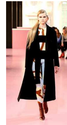
Raf Simons pour Dior