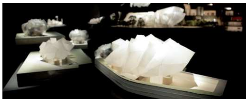
Exposition Frank Gehry - Galerie 4